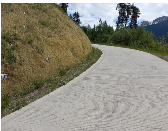
Betonstrasse und Böschung mit Felsankern Lüen-Galgenbüel