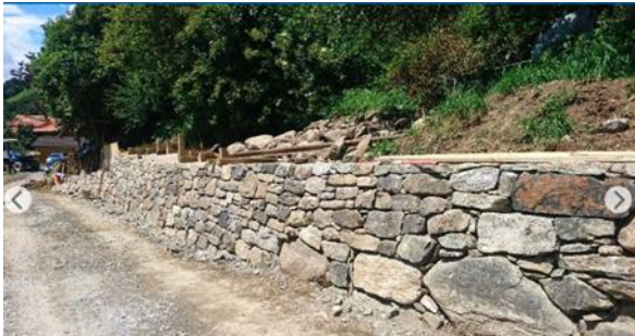
Beispiel einer Trockenmauer Webseite ALG Stützmauer ohne Ortsangabe (evtl. zwischen Trin und Tamins)