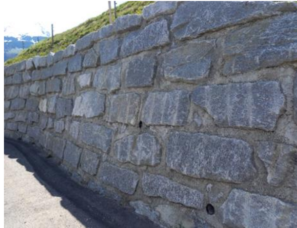
Häufiger Stützmauertyp im Schanfigg mit ausbetonierte Fugen