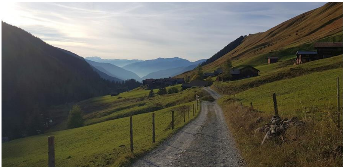
Heutiges Fahrsträsschen und Wanderweg im Sapün