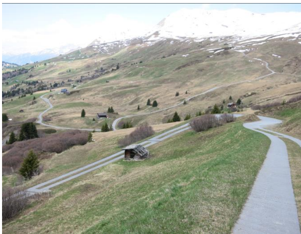
Zalüenja, Blick nach Westen