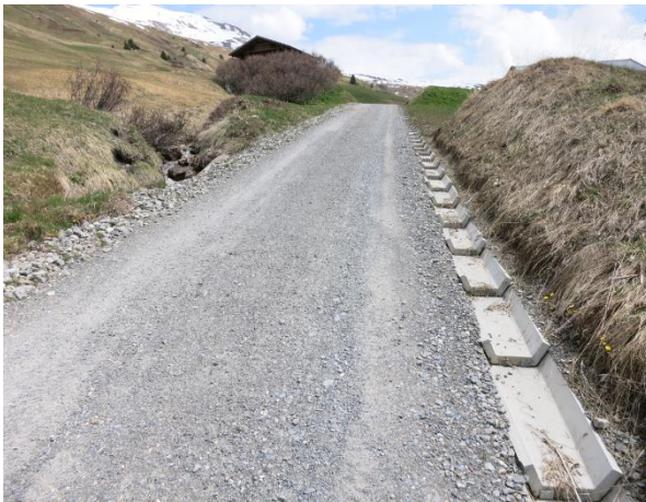
Wasserabzugsgraben aus Betonelementen