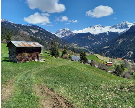
Dörferweg oberhalb Peist