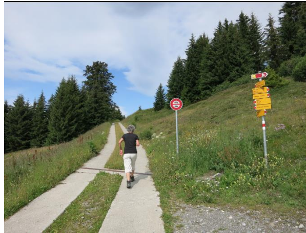
Triemel Richtung Bleis-Hochwang