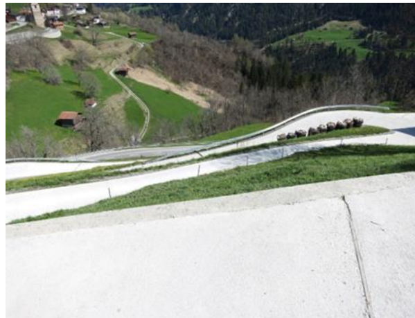
Durchgehend betonierte Hofzufahrt St. Peter/Pagig