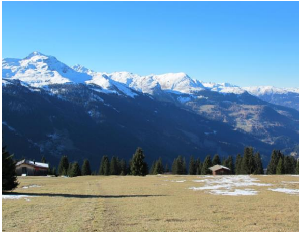
Pirigen vor und nach dem Bau