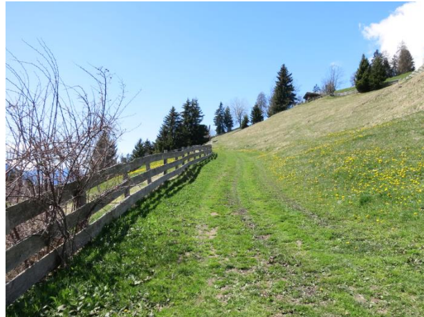
Dörferweg oberhalb Peist