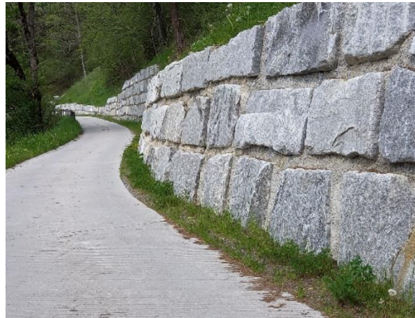
Lüen-Galgenbüel nach dem Bau