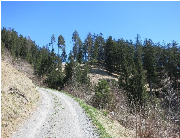
Lüen-Galgenbüel vor dem Bau der Meliorationstrasse