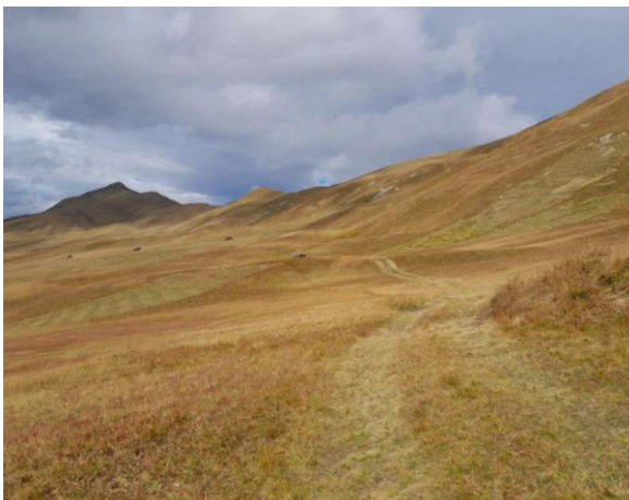
Unter Cunggel Richtung Goldgruben