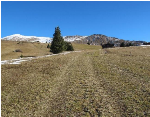
Pirigen/Nufsch vor und nach dem Bau