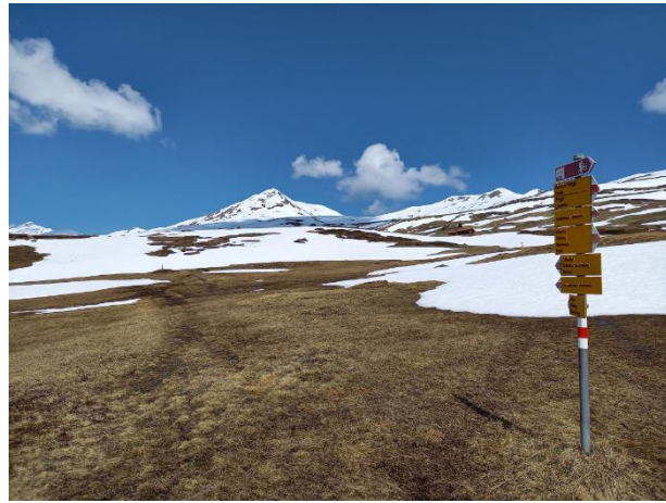
Höhenweg im Mooregebiet Calaufis