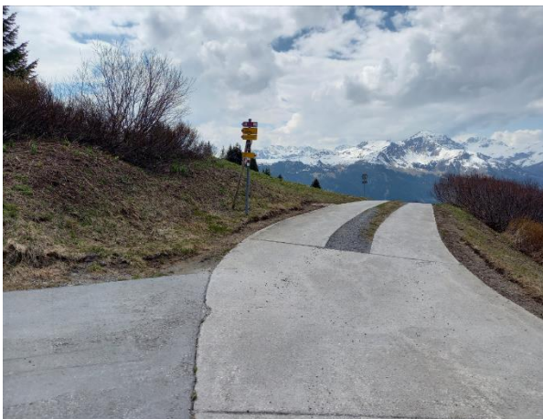
Beim Skihaus Hochwang